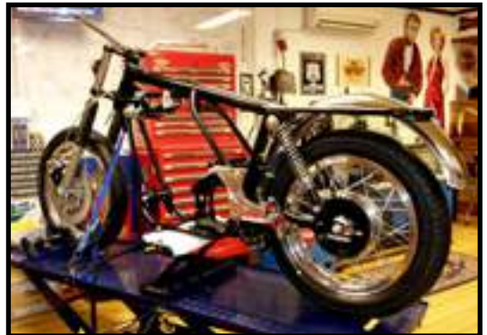
Her begynner monteringen etter at deler polert, lakkert og kjøpt inn i Kais romslige verksted.

Norton Commandoen blir trillet ut på grønn plen, over er himmelen blå - og lufta er fylt med parfyme fra blomster og trær. Til å bli forelsket av. Jeg forsøker den elstarteren først, den har ikke funket på ti år. Den slår inn og twin-en fyrer opp. For en lyd. Det fins ikke