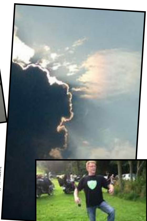
Tor med Hamneren var imom på lørdags morgenen, men han dro heldigvis videre