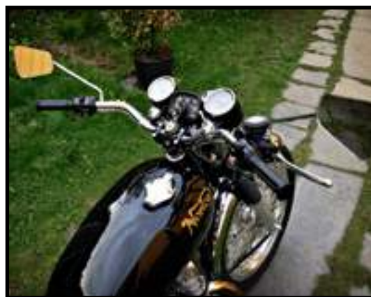
Det er nærmest umulig ikke å bestige denne skjønnheten.

Jeg håpet å vekke hans engelske instinkt.