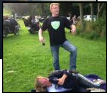
Rene mente han hadde beseiret en nordmann