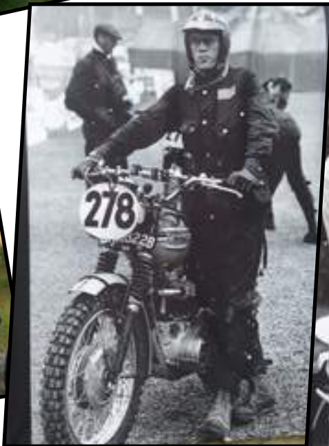
Treffplassen var pyntet med bilder av gamle helter med Triumph