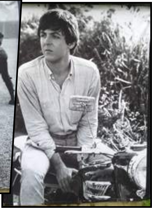
Macca kjørte jo selvfølgelig også Triumph