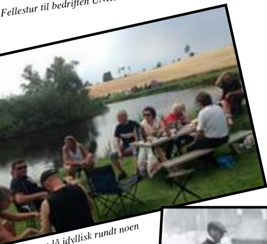
Campen lå idyllisk rundt noen små tjern.