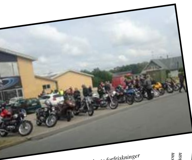
Fellestur til bedriften UNIKA med innlagte forfriskninger