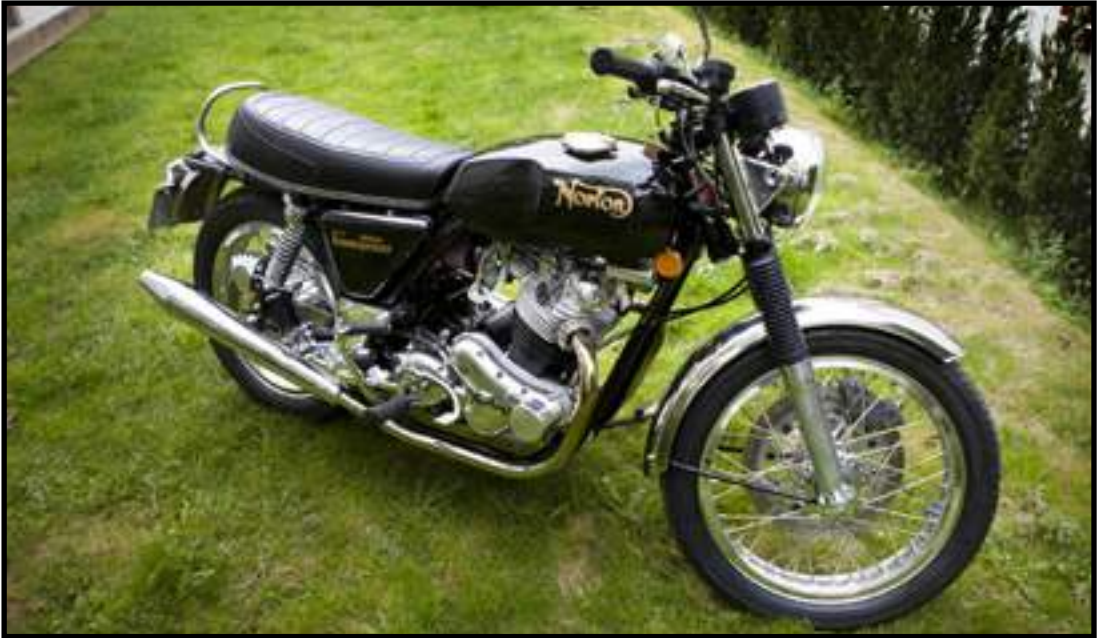
Norton Commando MKIII Roadster, fins det noe vakrere? Denne var en ratbike, nå er den en juvel.