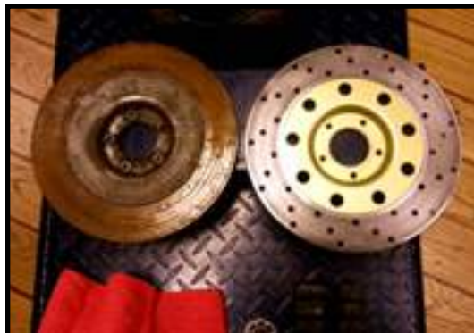
Her er bremseskiva gjennomgått en forvandling, bremsene foran ble byttet ut med større skive og kraftigere caliper.