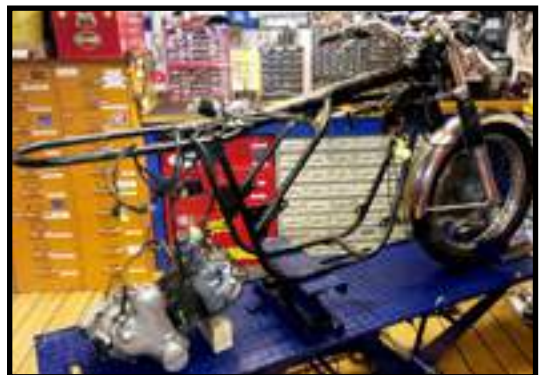
Her er nesten alt skrellet vekk fra ramma. Så naken ha den ikke vært siden den ble satt sammen en gang på 70-tallet.