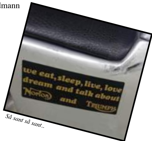
Så sant så sant..

Til gjengjeld var antallet deltagere fra UK nede på 10, noe som for første gang brakte dem under antallet av nordmenn, hvor antallet i år var 11. Til sammenligning hadde de til det 15. Britannia Rally (for 10 år siden): 193 innregistrerte, 29 kom fra UK, 11 fra Holland, 6 fra Sverige, 3 Finner og 1 Nordmann